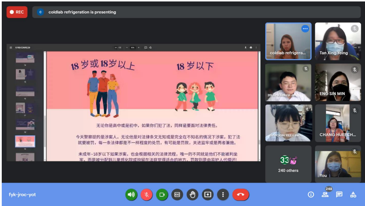
图 4、讲座内容 (4)